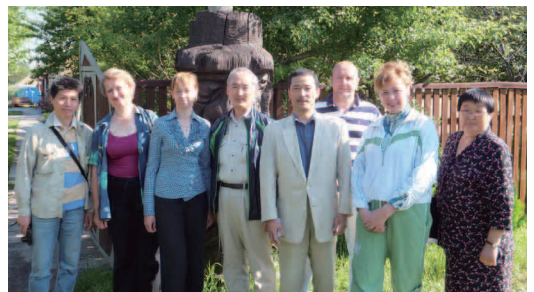
【宿泊：ラッキーハウスの女主人と妹】