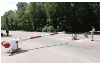
【高線量を示した場所】

書類はそろっているのに、兵士は「見たことがない」と言い、2時間ほどトラブルになる。